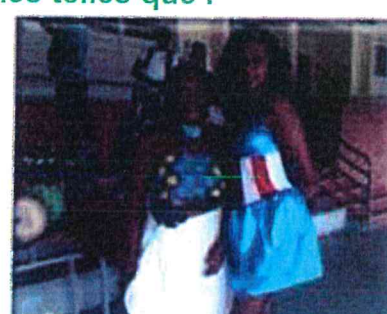
FETE DU CARNAVAL