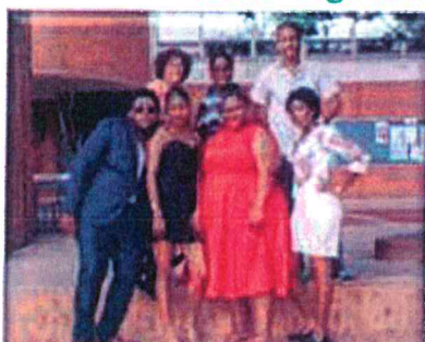
JOURNEE DE L'ELEGANCE

Nous organisons un grand nombre d'activités/sorties telles que :