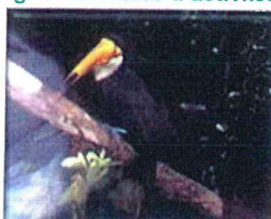
VISITE AU ZOO